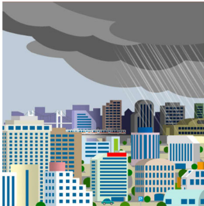
真っ黒い雲が近づく