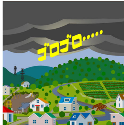
雷の音が聞こえてくる