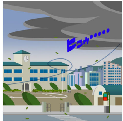
急に冷たい風が吹く