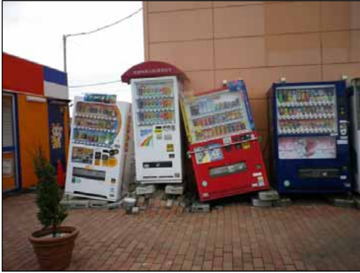
たおれそうな はんばいき