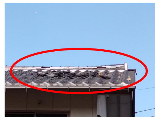
写真6 屋根瓦のずれ、落下