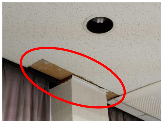
写真4 天井石膏ボードの剥離