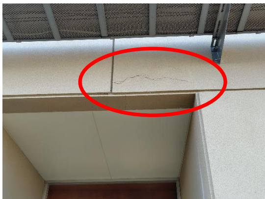
写真1 壁のひび割れ