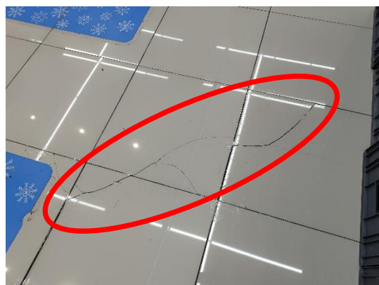
写真2 床タイルのひび割れ