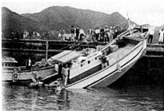
1979年3月31日の長崎県福江島富江港での船舶乗揚げ被害（西部海難防止協会「津波（長崎港アビキ）対策調査委員会報告書」（昭和57年3月）より）

観測史上最大の「あびき」は、1979年（昭和54年）3月31日に長崎検潮所（長崎県）で観測されたもので、最大全振幅（海面昇降の谷から山までの高さ）が278センチに達しました。