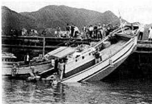
1979年3月31日の長崎県福江島富江港での船舶乗揚げ被害（西部海難防止協会「津波（長崎港アビキ）対策調査委員会報告書」（昭和57年3月）より）

観測史上最大の「あびき」は、1979年（昭和54年）3月31日に長崎検潮所（長崎県）で観測されたもので、最大全振幅（海面昇降の谷から山までの高さ）が278センチに達しました。