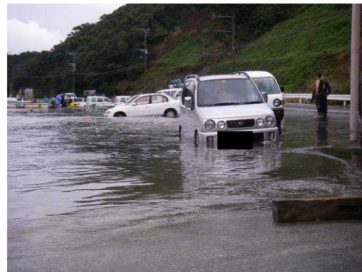
2009年2月25日の鹿児島県上甕島での道路冠水