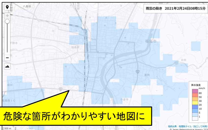
雨雲の動き（令和3年2月24日 福島市を表示）

https://www.jma.go.jp/jma/kishou/known/bosai/riskmap.html