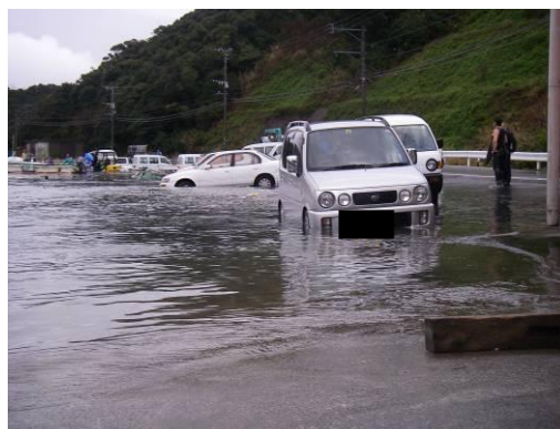
2009年2月25日の鹿児島県上甕島での道路冠水