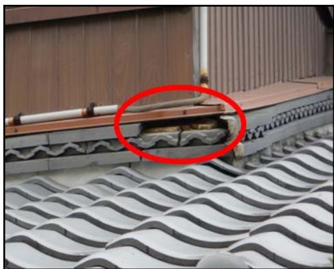
写真3 民家の瓦の落下