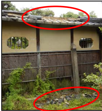
写真6 民家の瓦の落下