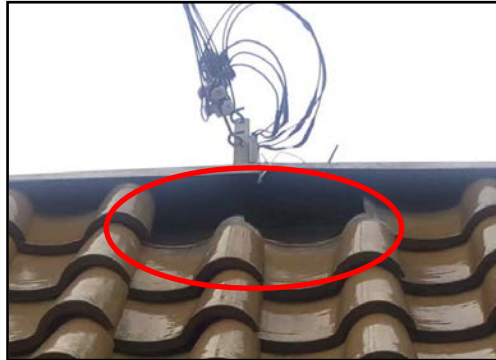
写真 12 民家の瓦の落下