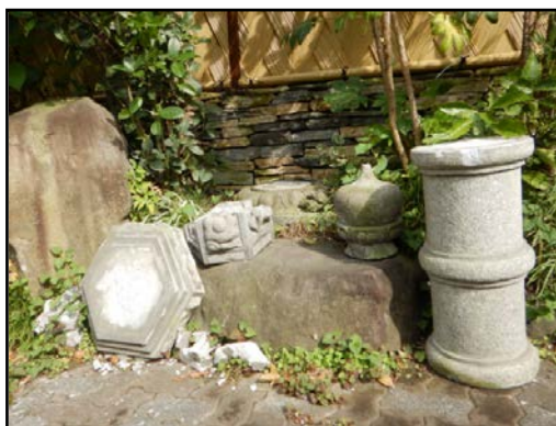
写真11 石灯籠の転倒