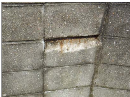
写真4 ブロック塀の剥離