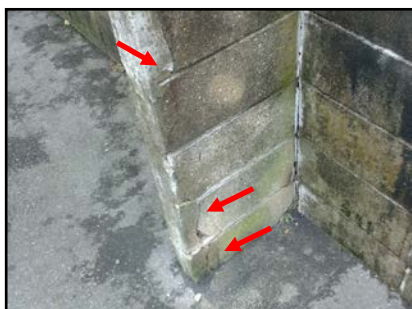
写真9 ブロック塀のひび割れ