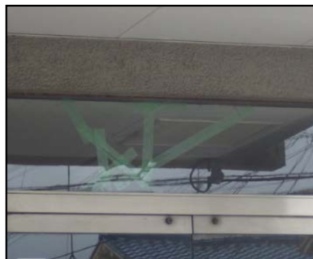
写真2 ガラスのひび