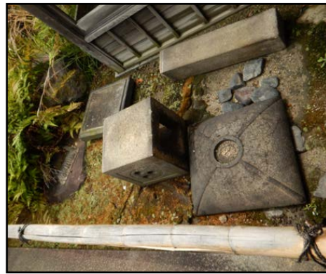
写真7 石灯籠の転倒