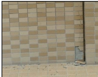
写真10 アパート外壁のひび割れ・剥離