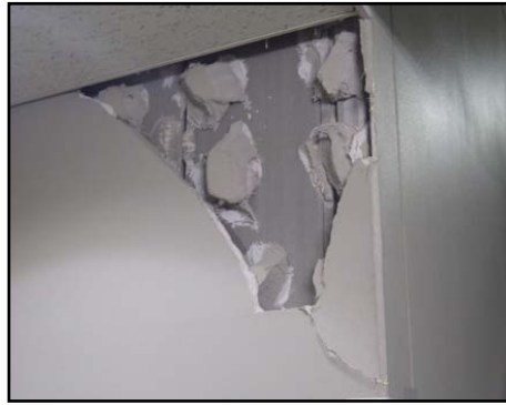
写真5 建物内壁の剥離