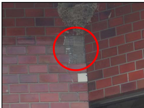
写真1 建物外壁の剥離