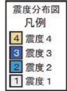
図3 震度分布図（各図の左上の数字は表1、図2の番号に対応する。+印は震央を示す。）

与那国島近海の地震（No. 1）及びその余震（No. 2～3）の震度分布図については p46 を参照。