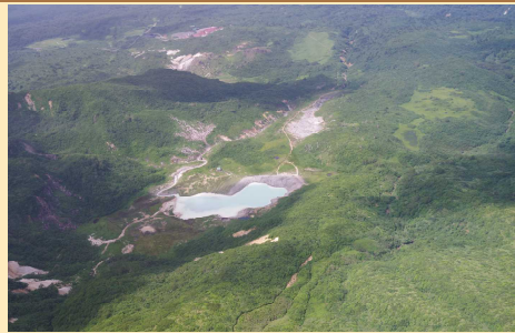
昭和湖を南から望む