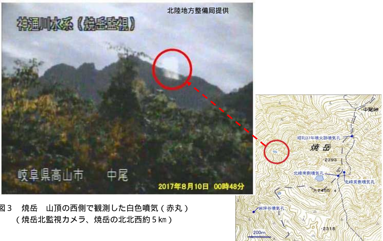
図3 焼岳 山頂の西側で観測した白色噴気（赤丸） （焼岳北監視カメラ、焼岳の北北西約 5 km）

噴火予報（噴火警戒レベル1、活火山であることに留意）の予報事項に変更はありません。