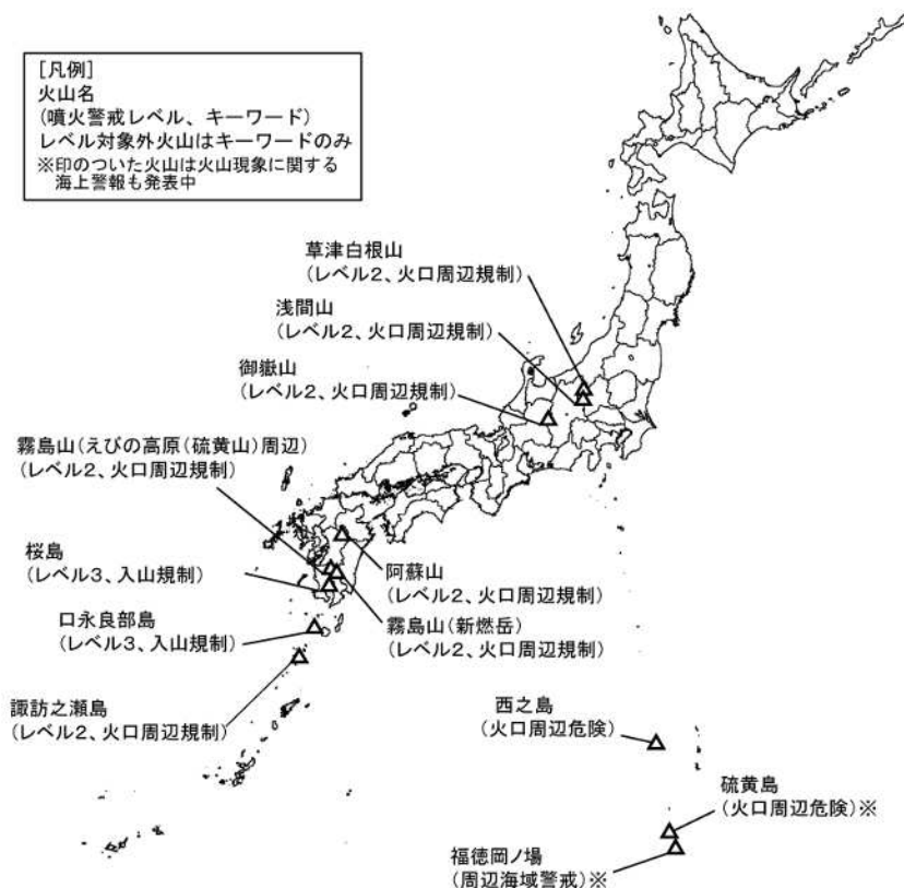
図 1 火山現象に関する警報を発表中の火山（12月22日現在）