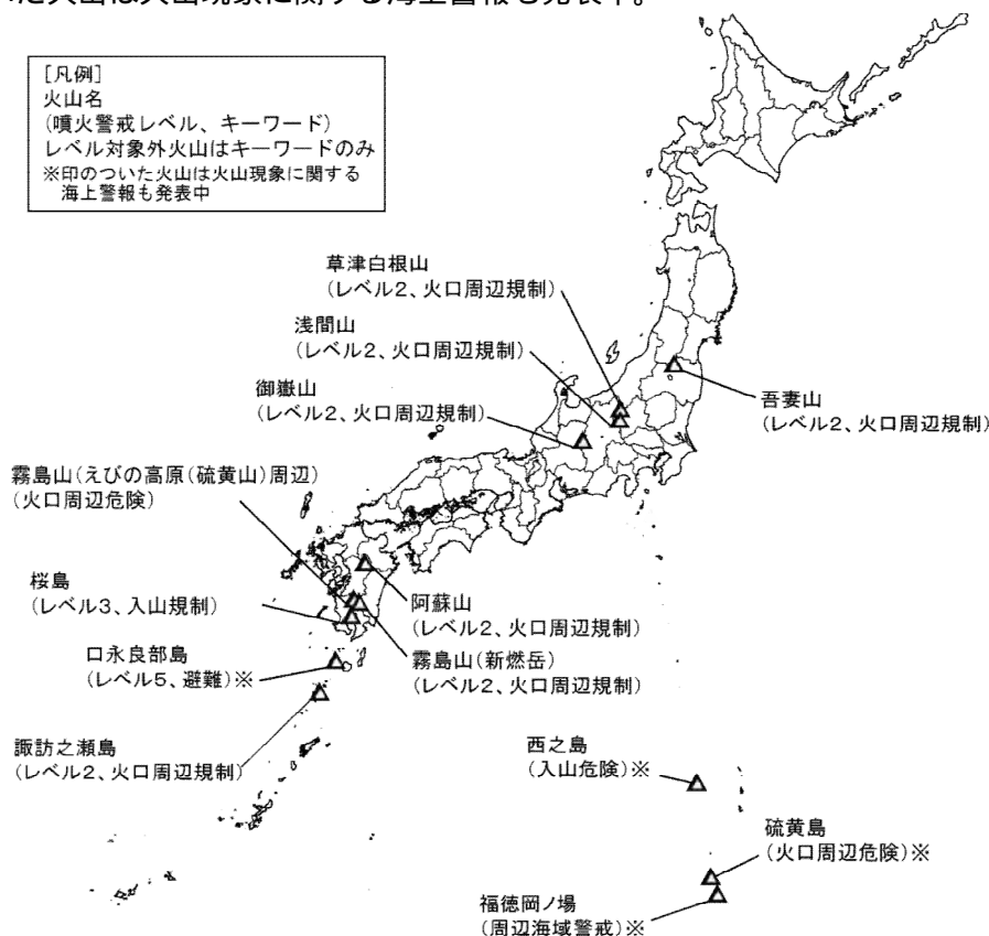
図 1 火山現象に関する警報を発表中の火山 (3 月 17 日現在)

この資料は気象庁ホームページ ( http://www.data.jma.go.jp/svd/vois/data/tokyo/volcano.html ) にも掲載しています。