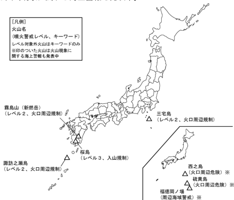
図 1 火山現象に関する警報を発表中の火山 (11 月 21 日現在)