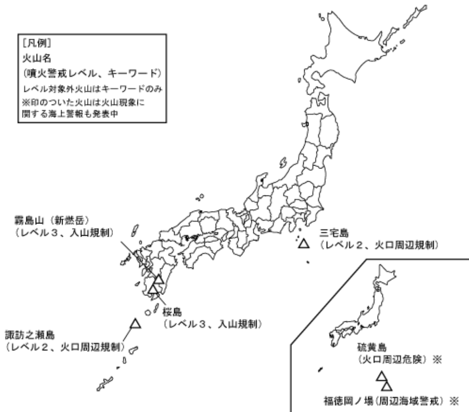
図 1 噴火警報及び火山現象に関する海上警報を発表中の火山（8月15日現在）