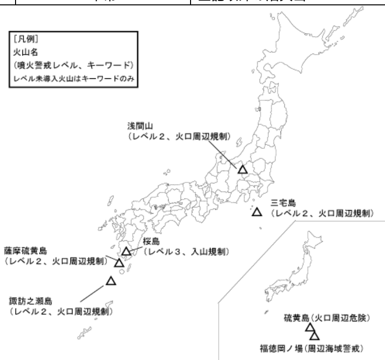
図 1 噴火警報発表中の火山（10 月 30 日現在）