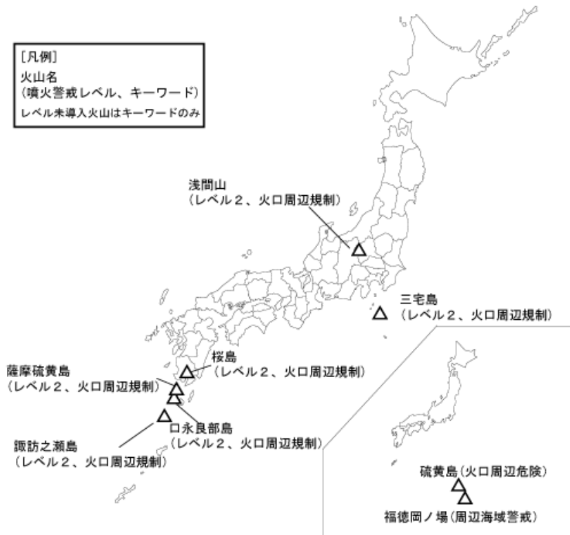
図 1 噴火警報発表中の火山 (5 月 7 日現在)