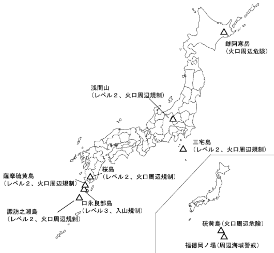
図 1 噴火警報発表中の火山 (11 月 27 日現在)

* 噴火警戒レベルは、その活用が地域防災計画等で予め定められており、レベル毎の防災対応をキーワードで示している。噴火警戒レベルを導入していない火山については、警戒事項をキーワードで示している。(本概況末の対応表参照)