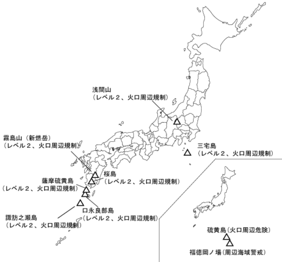
図1 噴火警報発表中の火山（9月4日現在）

*噴火警戒レベルは、その活用が地域防災計画等で予め定められており、レベル毎の防災対応をキーワードで示している。噴火警戒レベルを導入していない火山については、警戒事項をキーワードで示している。（本概況末の対応表参照）