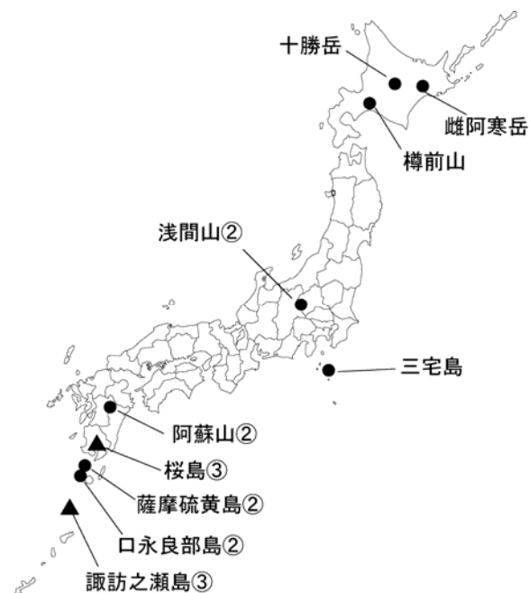
図 1 今期間掲載した各火山の活動状況

注 1 本資料中で記したレベルとは、火山活動度レベルを導入した火山におけるレベルを言う。