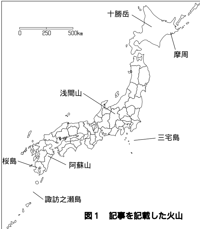
図1 記事を記載した火山

摩周では地震がやや多くなっている。十勝岳では微動があった。浅間山では小規模な噴火があった。三宅島では噴煙活動が継続した。阿蘇山では孤立型微動の多い状態が継続した。桜島では噴火があった。諏訪之瀬島では連続微動があった。