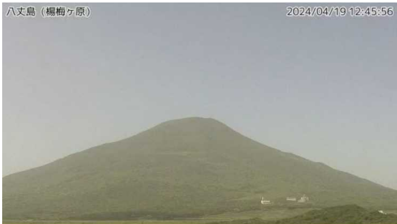
図1 八丈島 西山山頂部の状況（4月19日、楊梅ヶ原 ようめがはら 監視カメラによる）