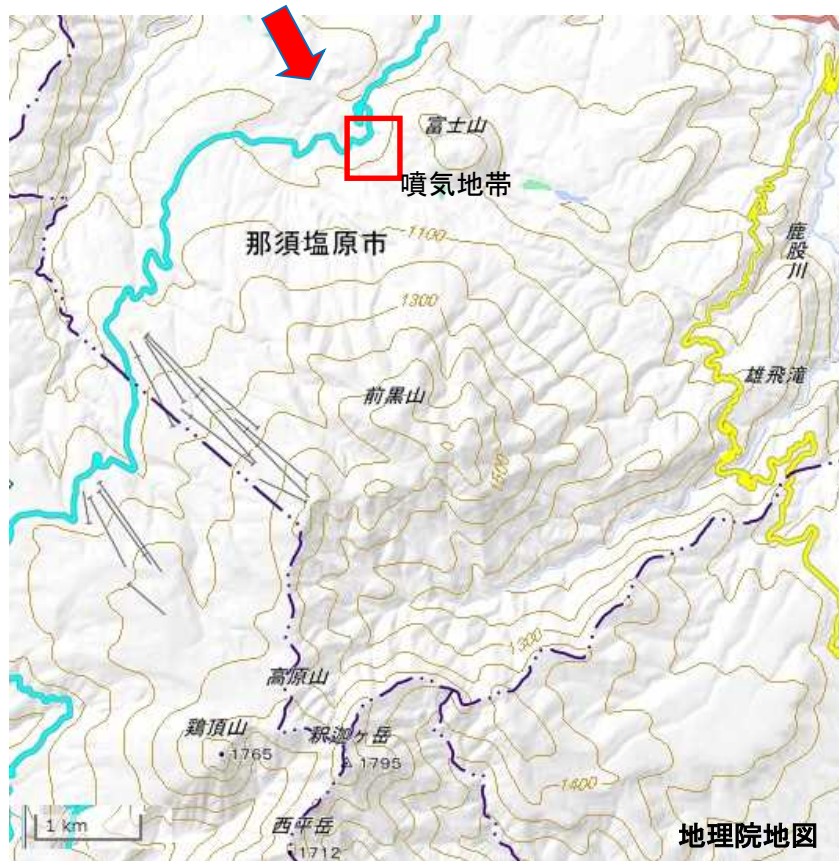
図1 高原山 新湯温泉の噴気地帯（図2）の撮影方向

新湯温泉の噴気地帯では地熱域は認められたものの噴気は認められず、前回の観測（2017年10月26日）と比較して、特段の変化は認められませんでした。