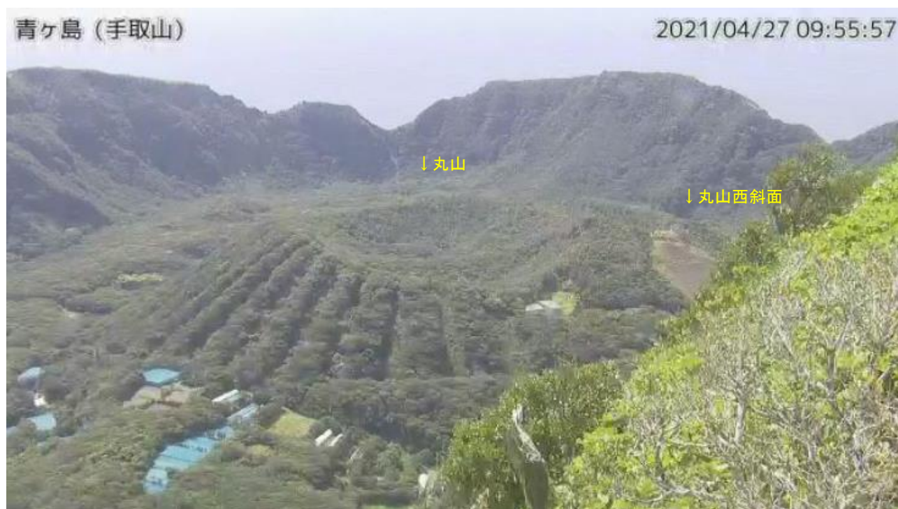
図1 青ヶ島 丸山周辺の状況（4月27日 手取山監視カメラによる）

この火山活動解説資料は気象庁ホームページ（ https://www.data.jma.go.jp/svd/vois/data/tokyo/STOCK/monthly_v-act_doc/monthly_vact.php ）でも閲覧することができます。