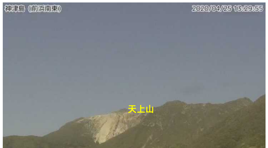
図2 神津島 天上山山頂部の状況 （4月25日、前浜南東監視カメラによる）