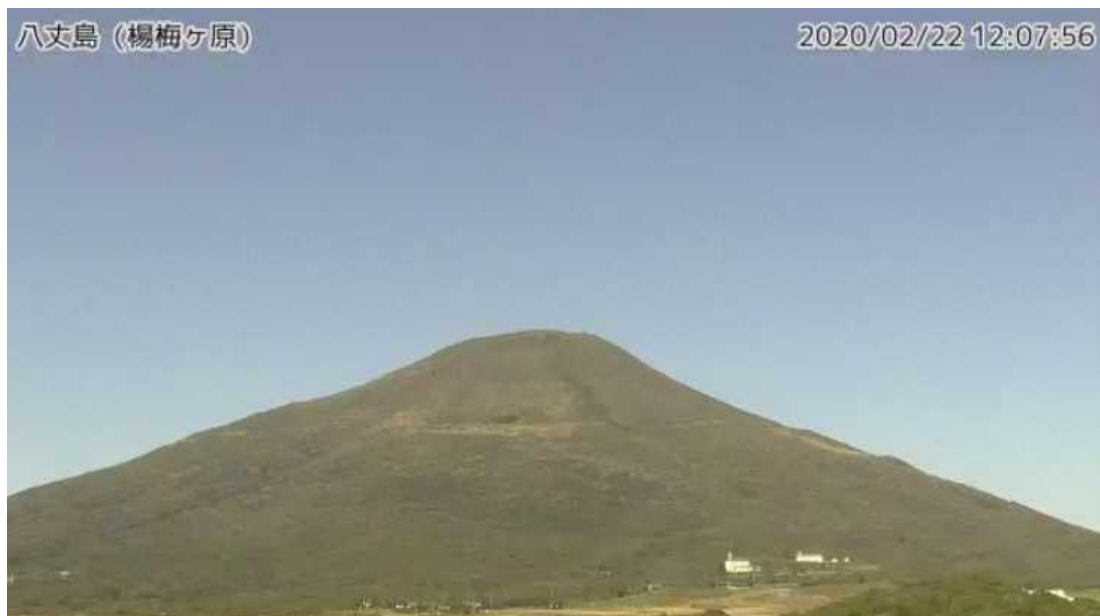
図1 八丈島 西山山頂部の状況 (2月22日、楊梅ヶ原 ようめがはら 監視カメラによる)

この火山活動解説資料は気象庁ホームページ（ https://www.data.jma.go.jp/svd/vois/data/tokyo/STOCK/monthly_v-act_doc/monthly_vact.php ）でも閲覧できます。