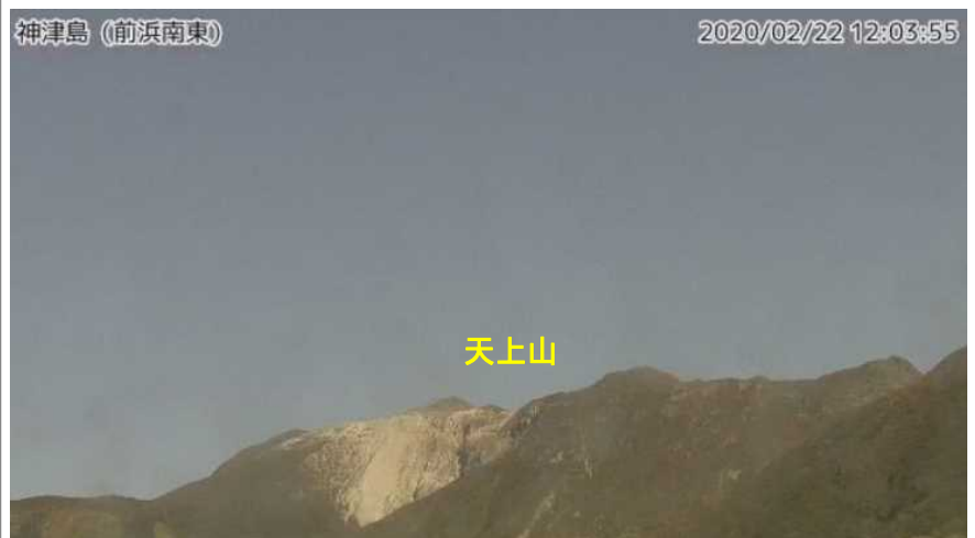
図2 神津島 天上山山頂部の状況 （2月22日、前浜南東監視カメラによる）