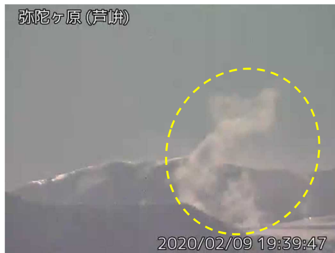
図1 弥陀ヶ原 地獄谷からの噴気の状況（黄丸）（2月9日、芦峠監視カメラによる）

この火山活動解説資料は気象庁ホームページ（ https://www.data.jma.go.jp/svd/vois/data/tokyo/STOCK/monthly_v-act_doc/monthly_vact.php ）でも閲覧できます。