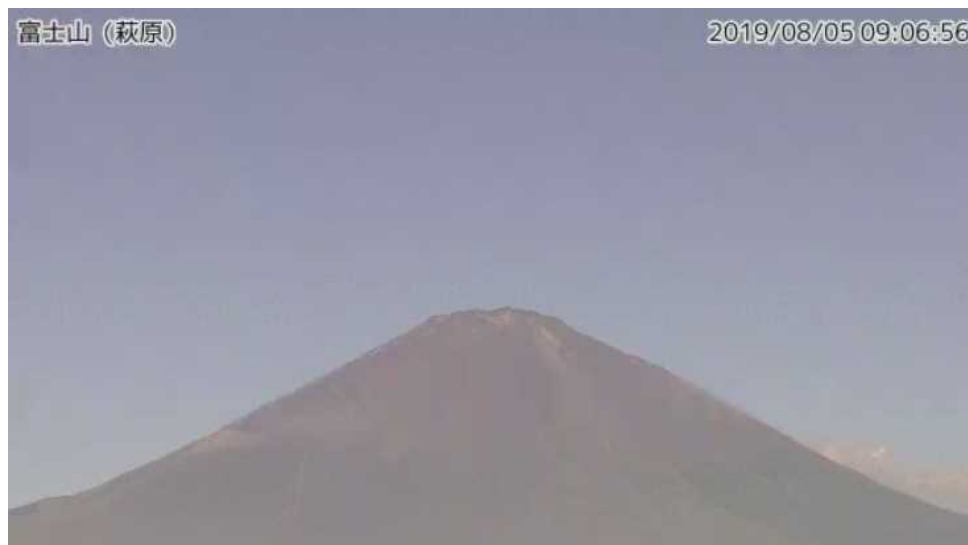
図1 富士山 山頂部の状況（8月5日 萩原監視カメラによる）

この火山活動解説資料は気象庁ホームページ（ https://www.data.jma.go.jp/svd/vois/data/tokyo/STOCK/monthly_v-act_doc/monthly_vact.php ）でも閲覧することができます。