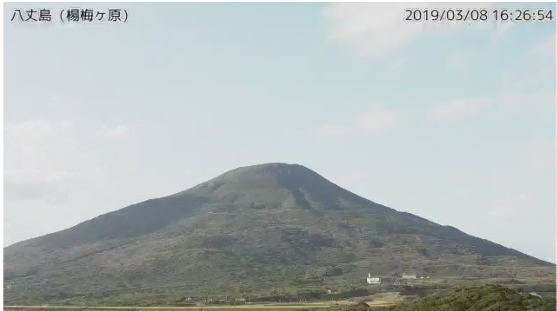
図1 八丈島 西山山頂部の状況 (3月8日、楊梅ヶ原監視カメラによる)