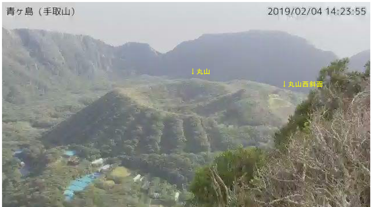
図 1 青ヶ島 丸山西斜面の状況（2 月 4 日 手取山監視カメラによる）

資料で用いる用語の解説については、「気象庁が噴火警報等で用いる用語集」を御覧ください。