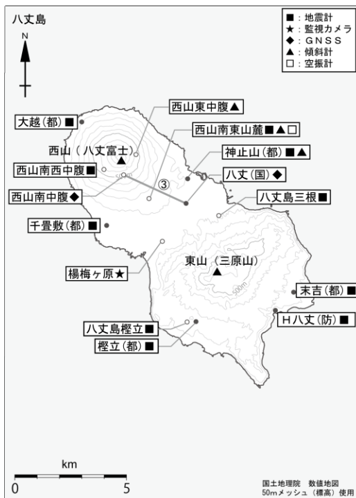
図4 八丈島 観測点配置図 GNSS 基線③は図2の③に対応しています。