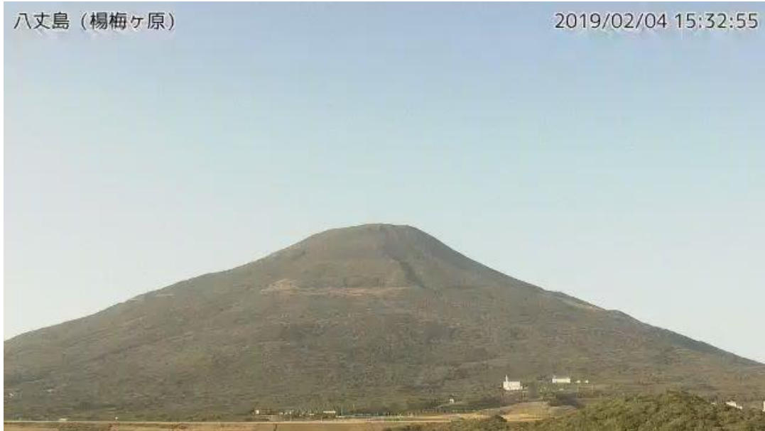
図 1 八丈島 西山山頂部の状況 （2月4日、楊梅ヶ原監視カメラによる）