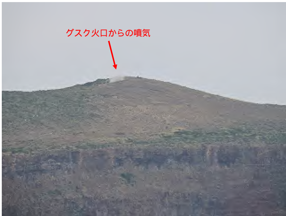
図 3 硫黄鳥島 グスク火口の状況（1月15日撮影）