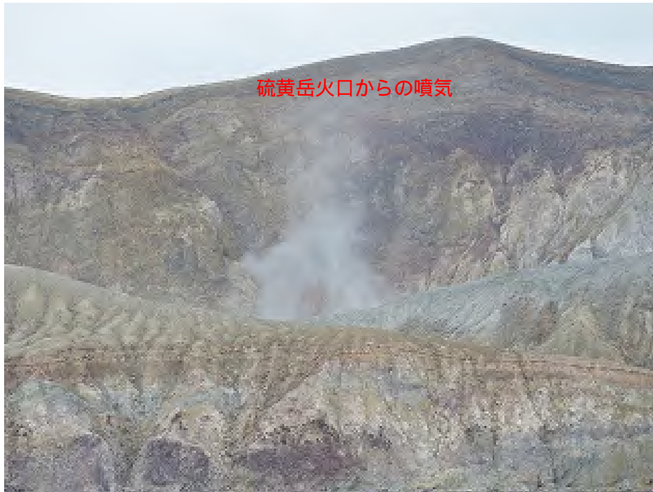
図 2 硫黄鳥島 硫黄岳火口の状況（1月15日撮影）