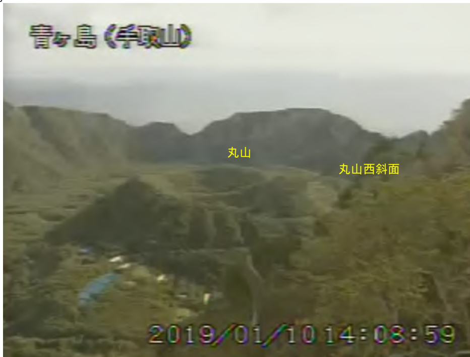
図1 青ヶ島 丸山西斜面の状況(1月10日 手取山監視カメラによる)

1) GNSS(Global Navigation Satellite Systems)とは、GPSをはじめとする衛星測位システム全般を示す呼称です。