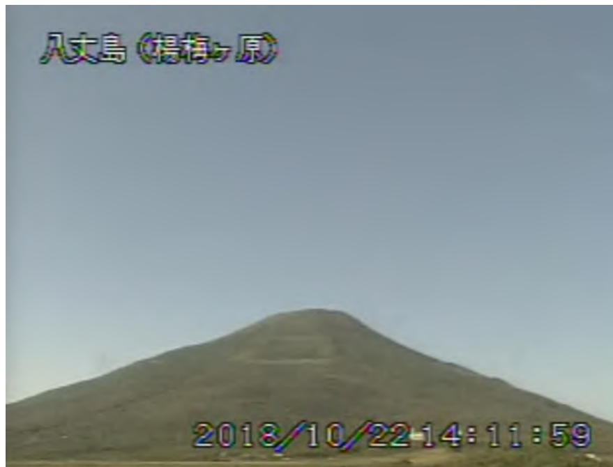
図 1 八丈島 西山山頂部の状況 (10月22日、楊梅ヶ原 ようめがはら 監視カメラによる)

1) GNSS (Global Navigation Satellite Systems) とは、GPSをはじめとする衛星測位システム全般を示す呼称です。