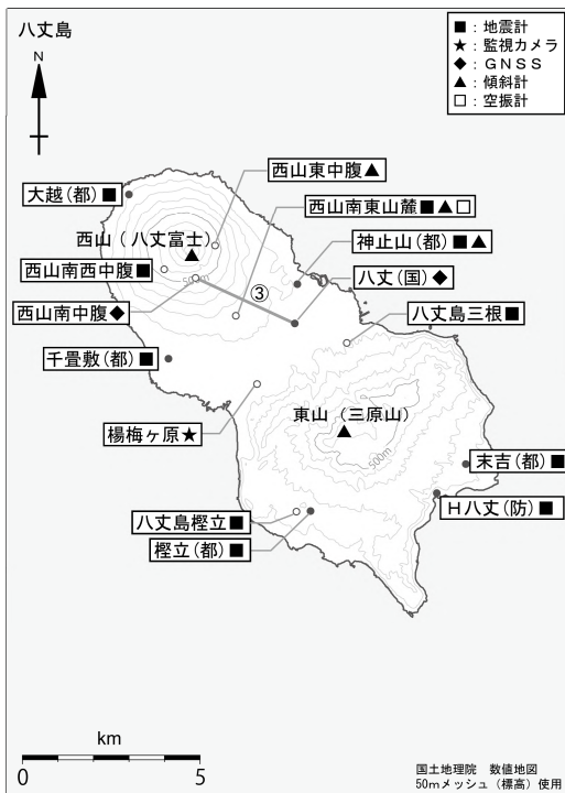
図4 八丈島 観測点配置図 GNSS基線は図2のに対応しています。

小さな白丸(○)は気象庁、小さな黒丸(●)は気象庁以外の機関の観測点位置を示しています。 (国): 国土地理院、(防) 防災科学技術研究所、(都): 東京都