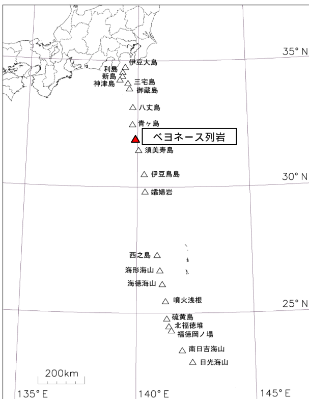
図 1 伊豆・小笠原諸島の活火山分布、 及びベヨネース列岩の位置図 ベヨネース列岩は、東京の南約 400km、青ヶ島の南 南東約 65km に位置します。

海上保安庁が 28 日に実施した上空からの観測では、明神礁付近の海水面に、変色水、気泡、浮遊物、低温部は確認されませんでした。