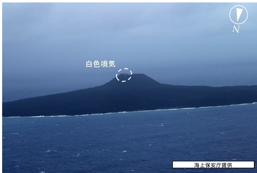
図2 西之島 噴火の様子（8月18日16時27分頃撮影）

海上保安庁が実施した上空からの観測によると、火砕丘中央の火口内東壁から白色噴気が上がっていました。