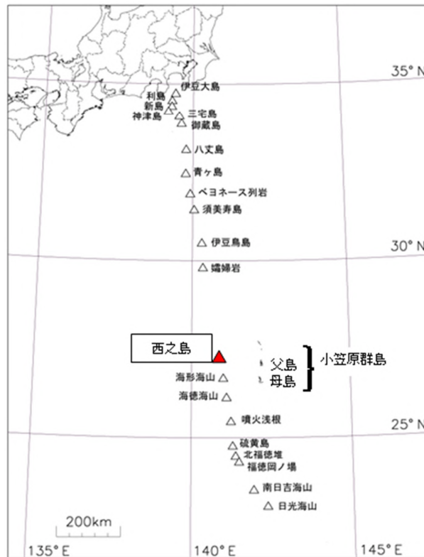
図1 伊豆・小笠原諸島の活火山分布、及び西之島の位置図 西之島は、東京の南約 1000km、父島の西約 130km に位置します。