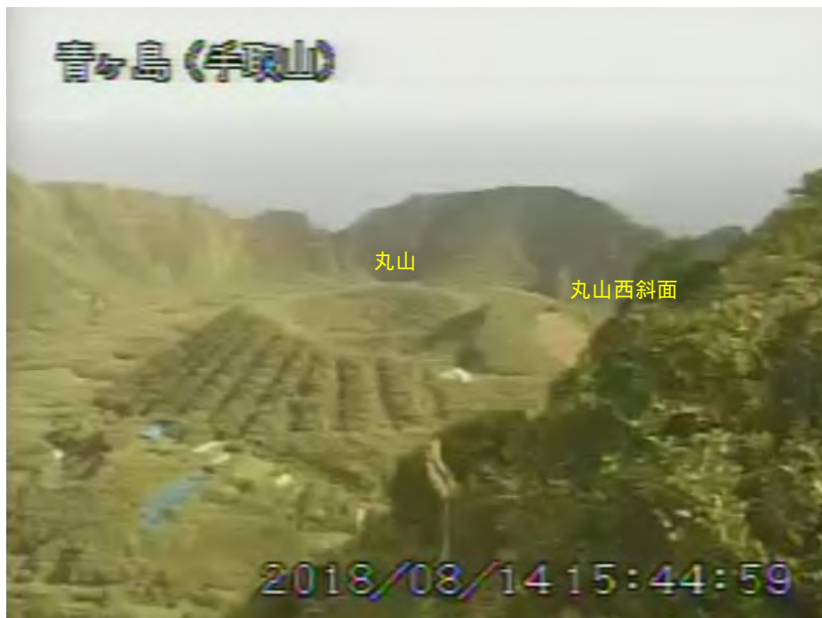
図 1 青ヶ島 丸山西斜面の状況（8 月 14 日 手取山監視カメラによる）

1) GNSS (Global Navigation Satellite Systems) とは、GPS をはじめとする衛星測位システム全般を示す呼称です。