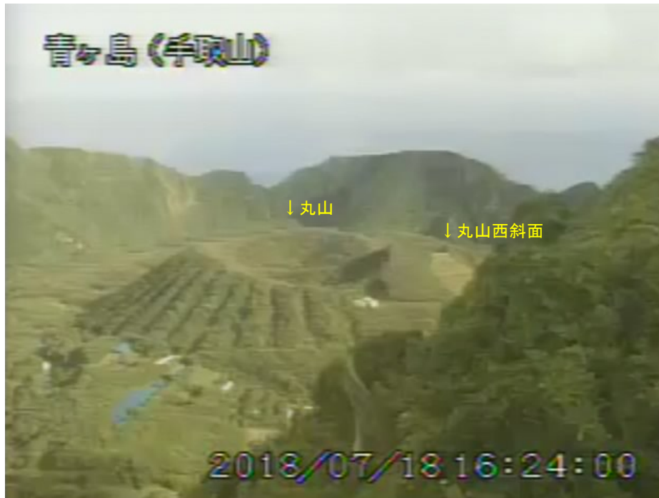
図 1 青ヶ島 丸山西斜面の状況（7 月 18 日 手取山監視カメラによる）

1) GNSS (Global Navigation Satellite Systems) とは、GPS をはじめとする衛星測位システム全般を示す呼称です。