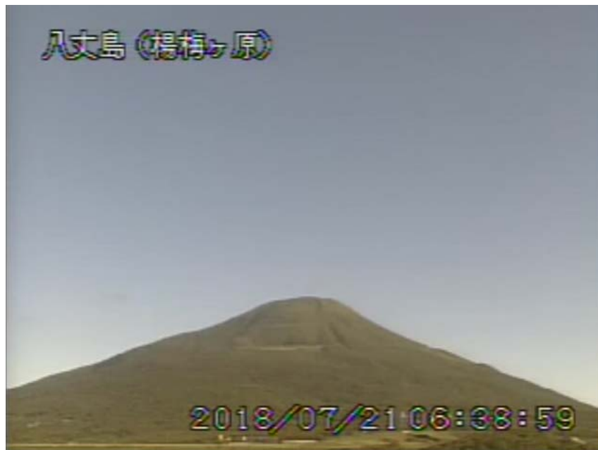
図 1 八丈島 西山山頂部の状況 (7月21日、楊梅ヶ原 ようめがはら 監視カメラによる)

1) GNSS (Global Navigation Satellite Systems) とは、GPSをはじめとする衛星測位システム全般を示す呼称です。