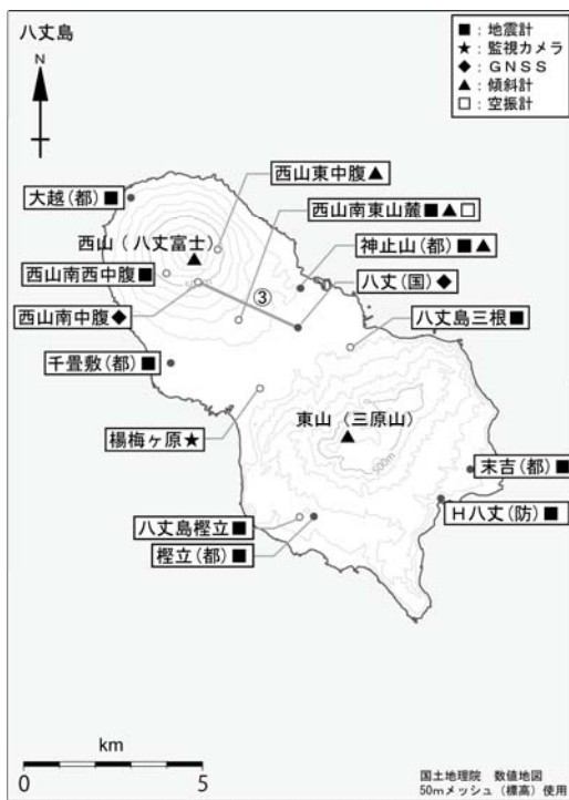
図4 八丈島 観測点配置図

今期間、八丈島の山体及びその周辺に震源が求まる地震は少なく、地震活動は静穏に経過しています。