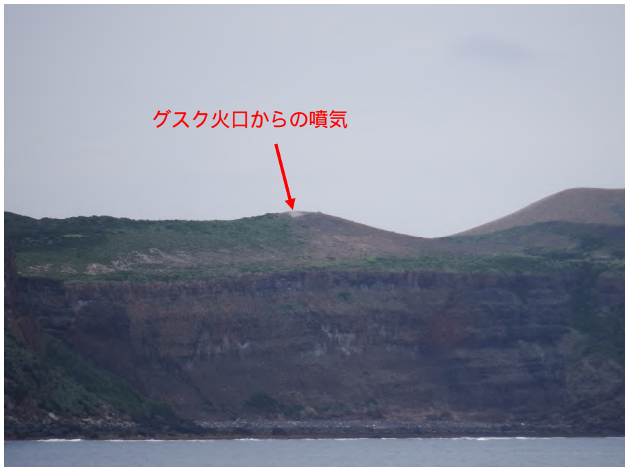
図3 硫黄島 グスク火口の状況(6月13日撮影)