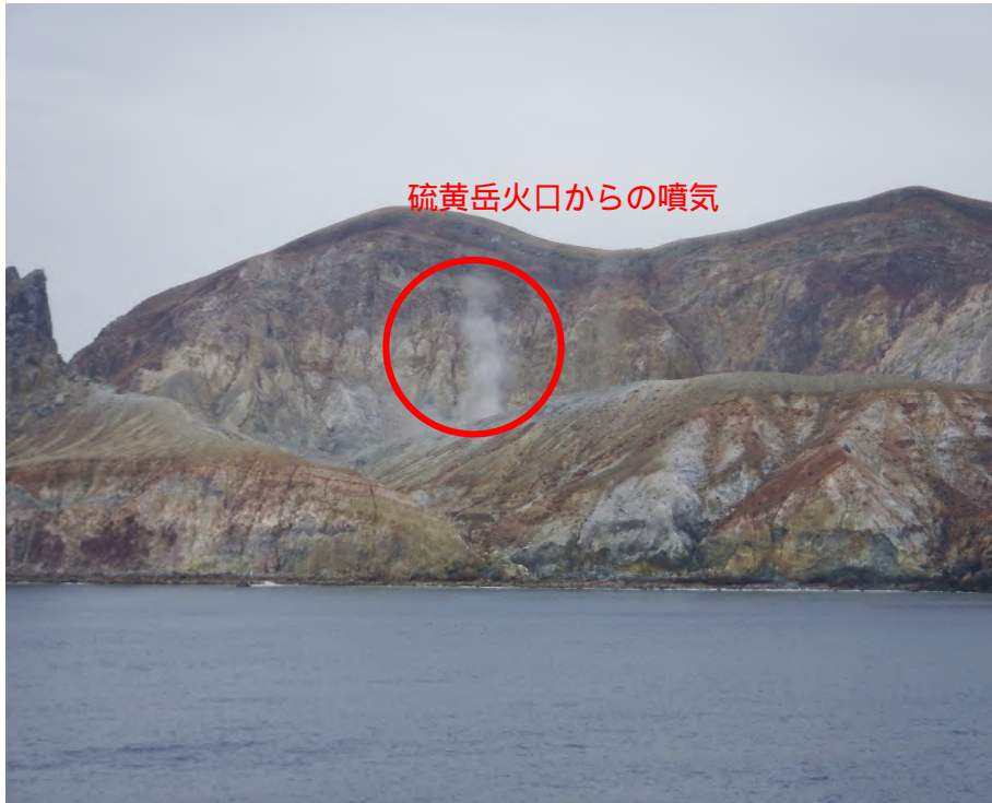
図2 硫黄島 硫黄岳火口の状況(6月13日撮影)