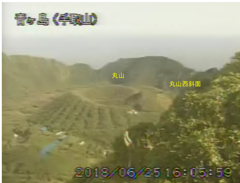
図 1 青ヶ島 丸山西斜面の状況（6 月 25 日 手取山監視カメラによる）

1) GNSS (Global Navigation Satellite Systems) とは、GPS をはじめとする衛星測位システム全般を示す呼称です。