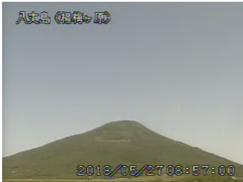
図 1 八丈島 西山山頂部の状況 (5月27日、楊梅ヶ原 ようめがはら 監視カメラによる)

1) GNSS (Global Navigation Satellite Systems) とは、GPSをはじめとする衛星測位システム全般を示す呼称です。