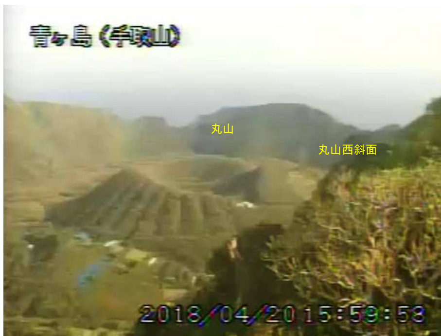
図 1 青ヶ島 丸山西斜面の状況（4 月 20 日 手取山監視カメラによる）

1) GNSS (Global Navigation Satellite Systems) とは、GPS をはじめとする衛星測位システム全般を示す呼称です。