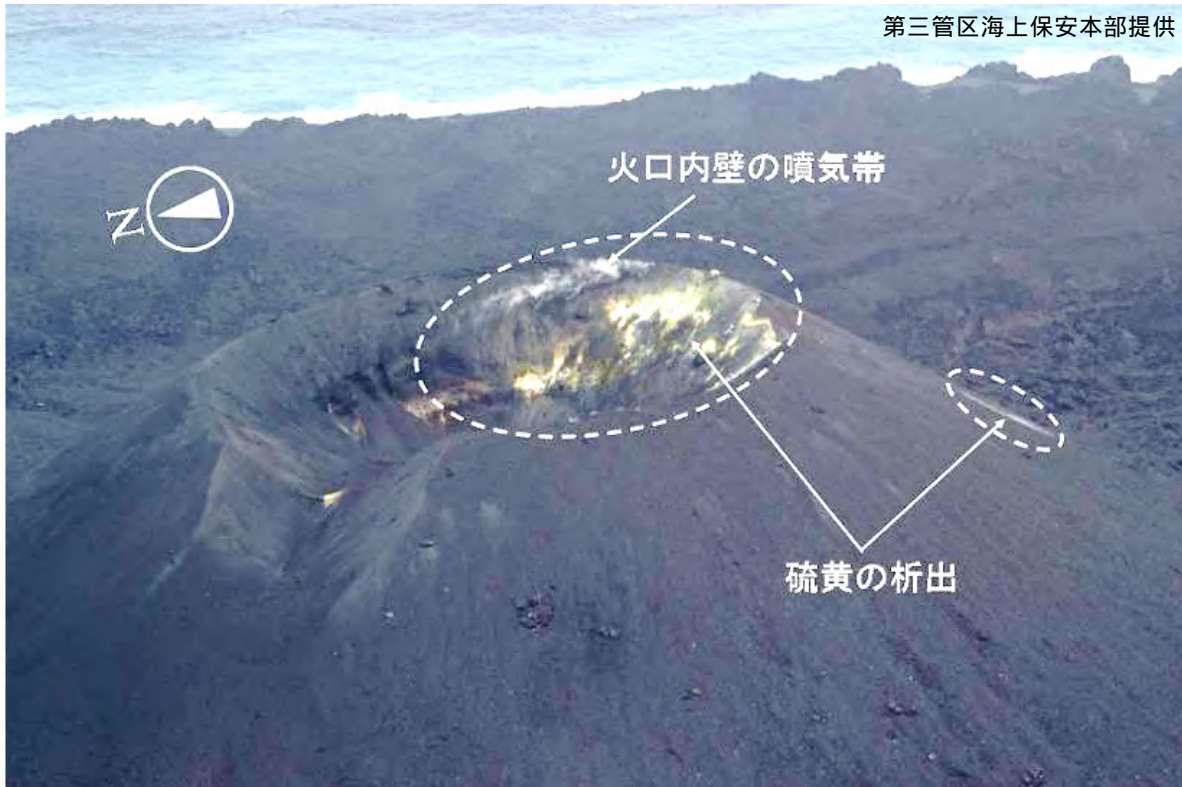
図1 西之島 島の中央部やや南に位置する火砕丘の山頂火口から上がる白色噴気(3月19日撮影)