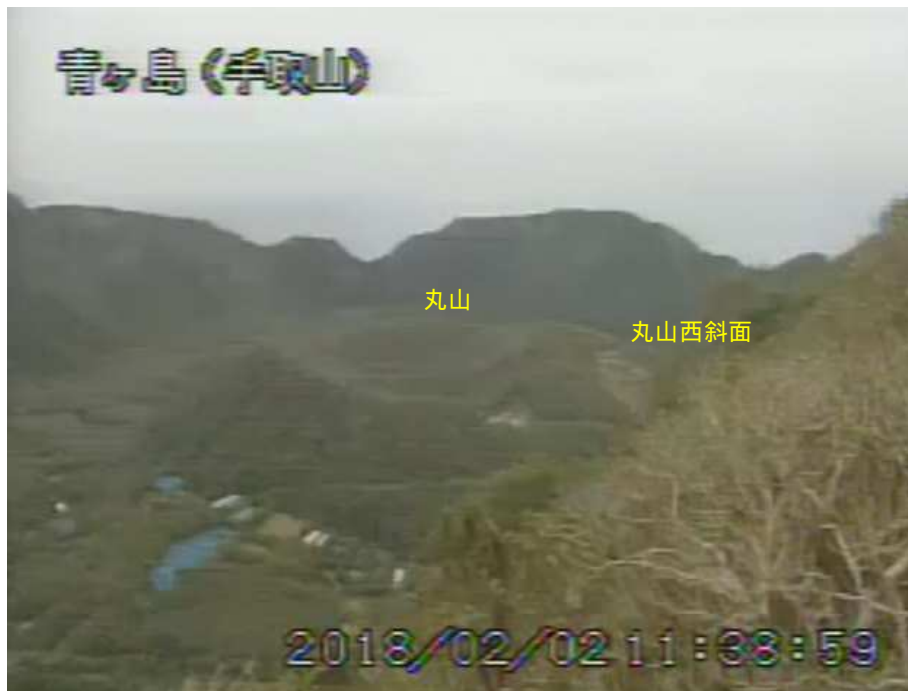
図 1 青ヶ島 丸山西斜面の状況（2月2日 手取山監視カメラによる）

1) GNSS (Global Navigation Satellite Systems) とは、GPS をはじめとする衛星測位システム全般を示す呼称です。