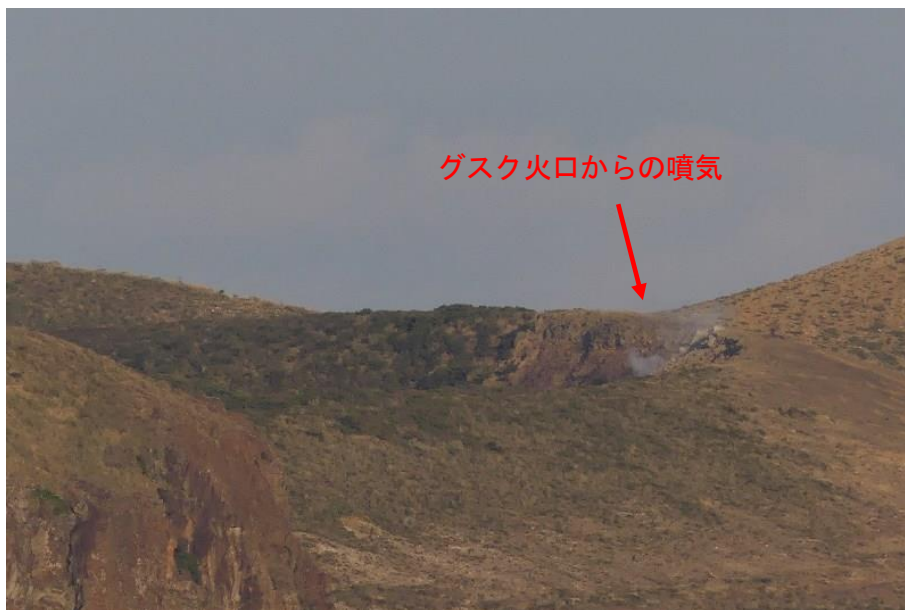
図3 硫黄島 ガスク火口の状況（1月15日撮影）