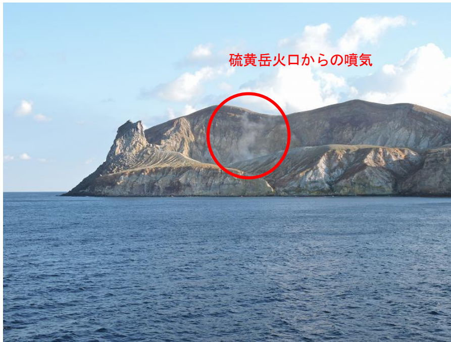
図2 硫黄島 硫黄岳火口の状況（1月15日撮影）