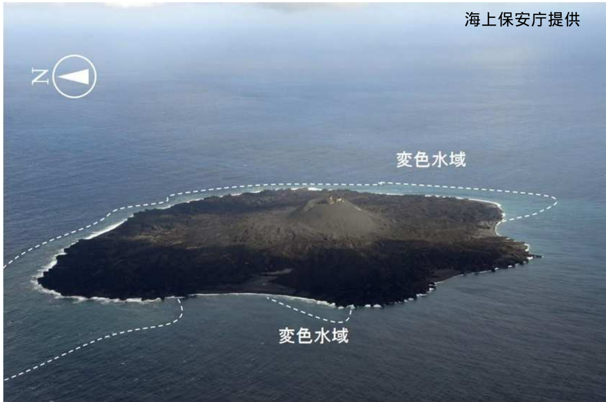
図2 西之島 島沿岸に分布する変色水域(1月15日撮影)