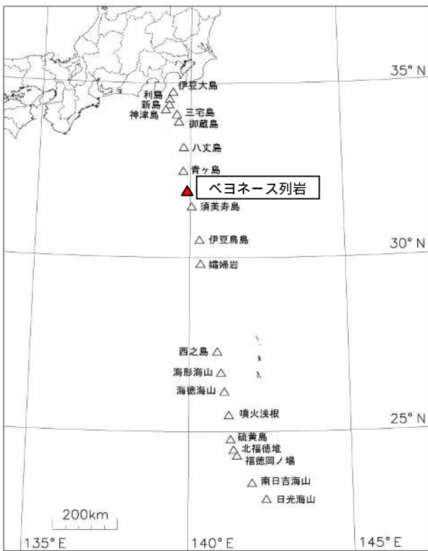
図 1 伊豆・小笠原諸島の活火山分布、 及びベヨネース列岩の位置図 ベヨネース列岩は、東京の南約 400km、青ヶ島の南南 東約 65km に位置します。

海上保安庁が 15 日に実施した上空からの観測では、明神礁付近の海水面に、変色水、気泡、浮遊物、低温部等は確認されませんでした。