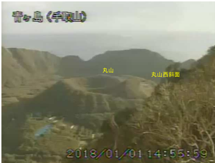
図 1 青ヶ島 丸山西斜面の状況（1 月 1 日 手取山監視カメラによる）

1) GNSS (Global Navigation Satellite Systems) とは、GPS をはじめとする衛星測位システム全般を示す呼称です。